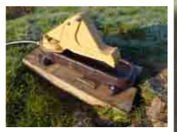
Pompe à museau