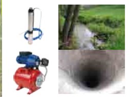
Pompe immergée ou groupe hydrophore