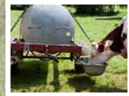
Tonne à eau