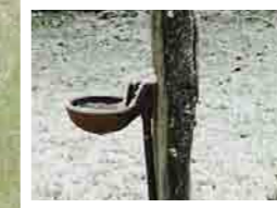
Eau de conduite